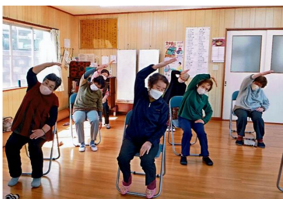
写真右下：公民館講座「陶器作り（左側）」