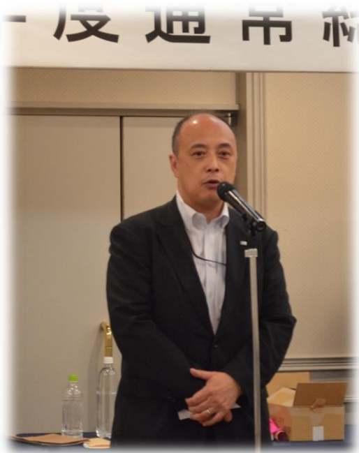
<懇親会：JTB 岩泉東北仕入販売部長様ご挨拶>