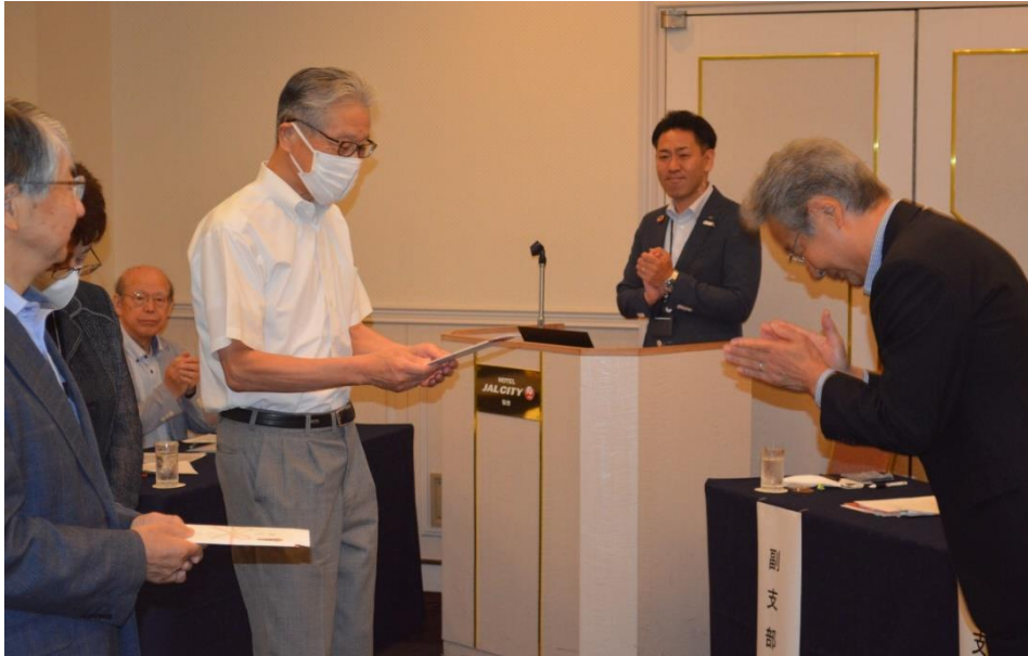
<お客様紹介運動取扱実績上位3名の皆様への顕彰式>