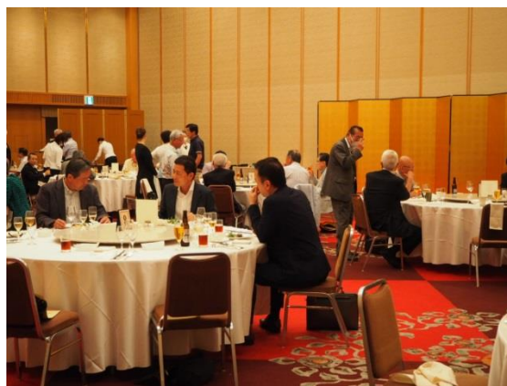
【和気あいあいの懇親会】