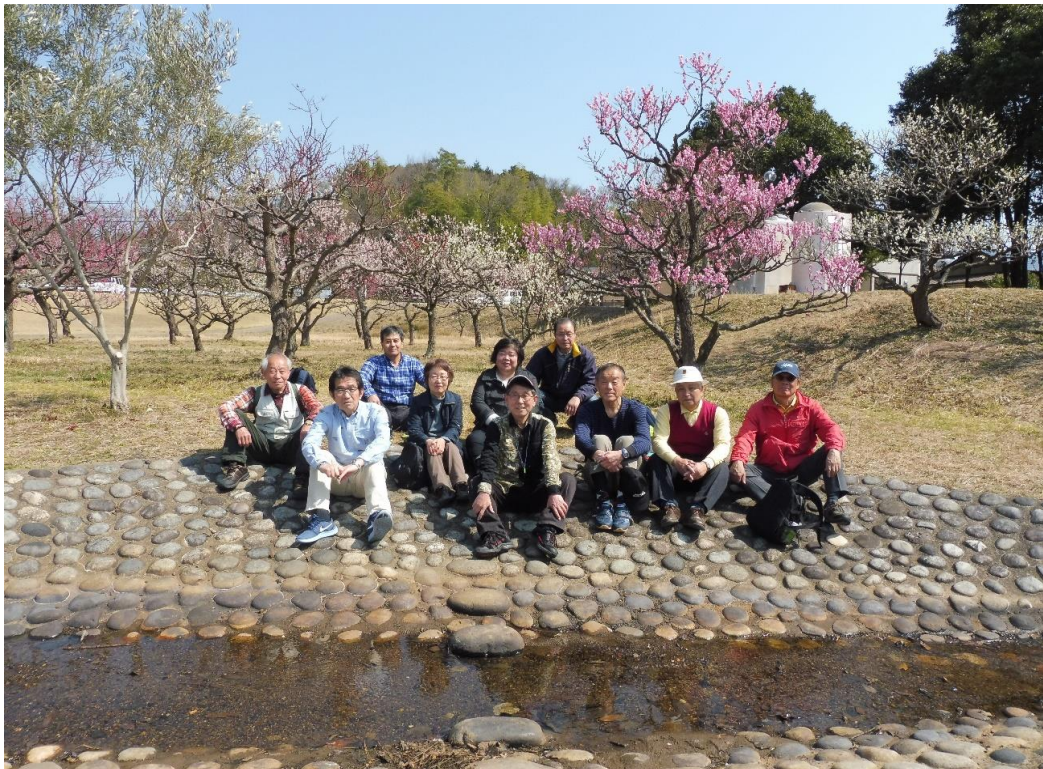
蘇原自然公園にて

名鉄各務原市役所前駅に集合。参加者10名、最初に駅からすぐの「学びの森」へ、銀杏やメタセコイアの並木が、韓国ドラマ冬ソナのロケ地に似ていると云うことで訪ねる人が多くなっている。新境川の堤防道路を歩き、途中から街中の道路を歩き40分程歩き「稲荷神社」へ、ここで15分程小休止した後、「蘇原自然公園」へ向かう。途中、八坂神社を参拝し、11時半頃到着する。梅園の梅は、七分咲きで少し早い。集合写真を撮った後、解散し、思い思いの場所でランチを摂る。時間に余裕があるので、公園内の端にある「伊吹の滝」、「伊吹の滝不動尊」を訪ねる。東海・北陸自動車道を潜り、急坂を登ったところに在る。ここから20分程かけて、コミュニティーバスの停留所まで歩く。コミュニティーバスは、病院、市民センター、スーパーなど各務原市内を巡って市役所前に14時頃到着、駅近くの喫茶店でコーヒータイム、30分程歓談した後解散する。大変に暑い一日でした。