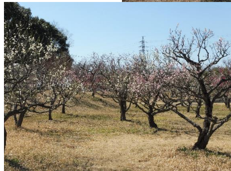
蘇原自然公園梅林