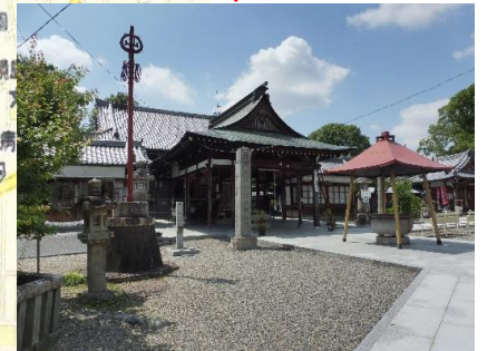
乙津寺(おっしんじ)・鏡島弘法