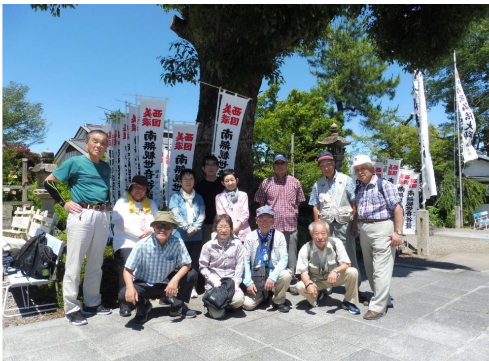
鏡島弘法(乙津寺)にて

大垣駅6番ホーム(樽見鉄道ホーム)に12名が集まる。10時05分発の電車で美江寺駅まで行き、駅近くの美江寺宿入口から中山道を歩く、25分で「本田(ほんでん)代官跡」に、今は案内板のみで面影はない。本田地蔵尊を参拝、ここで小休止する。15分歩いて「馬場公園」へ、少し時間的に早い、公園の木陰で昼食休憩をする。梅雨の間の晴まで雲一つない青空が広がる。木陰は涼しい風が通り抜けて心地良い。25分歩いて「河渡(ごうと)宿」へ入り、「河渡宿一里塚跡碑」を観て、「馬頭観音堂(愛染堂)」を参拝し、ここから長良川の河岸堤防を上流に向かって40分歩く、途中、岐阜城のある金華山、JR岐阜駅前の高層ビルが思ったより近くに見ることが出来る。「小紅の渡し」に着く。渡船は定員8人とのこと、2班に分かれて長良川を渡る。乗船時間は5分、県道の一部なので乗船料金は無料でした。船着場から5分歩いて「鏡島弘法・乙津寺(おっしんじ)」へ、本堂に上がって参拝をする。鏡島弘法前から岐阜バスに乗りJR岐阜駅へ、駅構