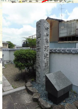
中山道河渡宿・一里塚碑