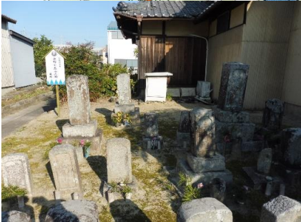
佐野七五三之助墓所