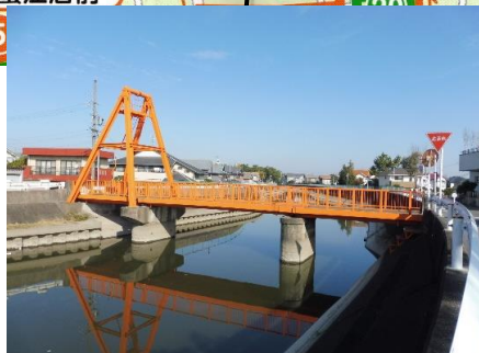
朱色の跳ね橋・御葎橋