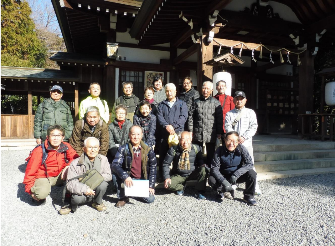
氷上姉子神社拝殿前

平成31年最初の「歩こうかい」はJR大高駅に集合、18名が参加する。最初に大高駅前から名古屋市営バスで砂畑バス停まで乗り、そこから「神話の道」を歩き始める。5分で熱田神宮の宮司が、日本武尊と宮簀媛の故事から建てた「寝覚の里」の碑を訪ね、15分程歩き、斎山古墳の上に建つ「斎山稲荷社」を参拝し、20分程歩いて、熱田神宮の摂社で、宮簀媛命を祀る「氷上姉子神社」を参拝する。日本武尊の死後「草薙剣」守護し、後に熱田神宮へ真剣を奉ったことから熱田神宮の発祥の地とも言われる。10分歩いて「石神白竜大王社」、5分歩いて、国の登録文化財の「大高山春江院」を参拝し、桶狭間の戦いの時、徳川家康の兵糧入れに成功したことで知られる「大高城跡」の登り、大高の町、遠くに鷲津砦跡を一望する。15分程街中を歩き、JR大高駅前の総会会場の「春乃家」に到着する。村会では、平成30年の会計報告、平成31年の年間計画、班編成が報告され、全会一致で承認される。その後、懇親会に入る。1時間半程、会