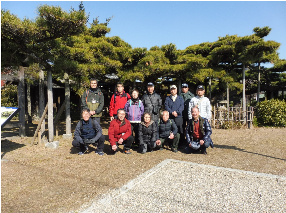
永安寺の雲竜の松にて

名鉄宇頭(うとう)駅に12名集合する。自宅を出るころは曇り空でしたが集合し歩き始めたころには太陽が顔をだしウォーキング日和となる。駅から5分歩くと国道1号線に出て暫く歩くと旧東海道との分岐点その先には松並木が見えてくる。松並木を10分程歩くと、太平洋戦争当時の元岡崎海軍航空隊の跡地に建つ「予科練の碑」、熊野神社を挟んで「尾崎の一里塚跡碑」、「鎌倉街道の塚跡」、ここでトイレ休憩をする。15分歩くと、「永安寺」に着く。境内一面に、県指定天然記念物の「雲竜の松」の枝が伸びている。参拝した後、5分程で、明治用水の開削記念と治水を祈願して建てられた「明治川神社」参拝する。20分程歩いて、旧東海道から少し逸れたところに在る、遊具と広い芝生広場の有る「柿田公園」へ、ここで昼食休憩をする。ここから10分歩いて「専超寺」、「白山比賣神社」参拝し、最後は国道1号線沿いに在るコメダ珈琲に入り30分程歓談する。新城駅まで歩き13時12分発の特急に乗る。