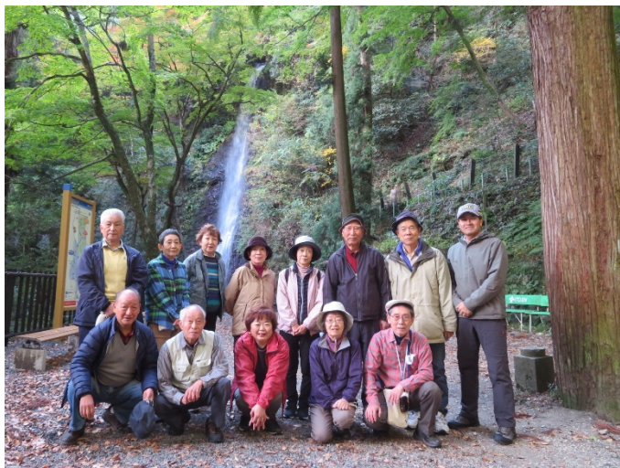
滝を背景に集合写真