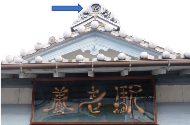
Yの字の瓦と瓢箪で描かれている駅名

10 時 15 分集合、オープン参加のお二人の紹介とコース説明をして元気よく出発。