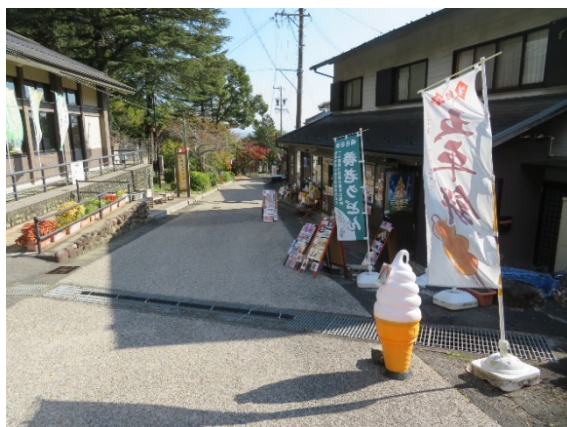
養老サイダーを販売する店が並ぶ