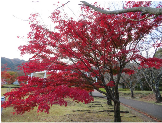
こどもの国園内の紅葉

養老の滝までの 2.5Km はゆるやかな登りが続き、こどもの国エリアに入ると沿道には黄色に輝く銀杏が立ち並び、園内のもみじは真っ赤に紅葉している。滝から流れ下る川沿いの紅葉の盛りは月末のようなのだが、両側に整備された歩道をつなぐ七つの橋の上からも景色を楽しみながら坂道をゆっくり上がる。