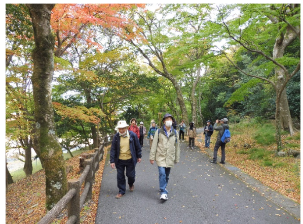
緑と紅葉の美しい景観を楽しみながら歩く