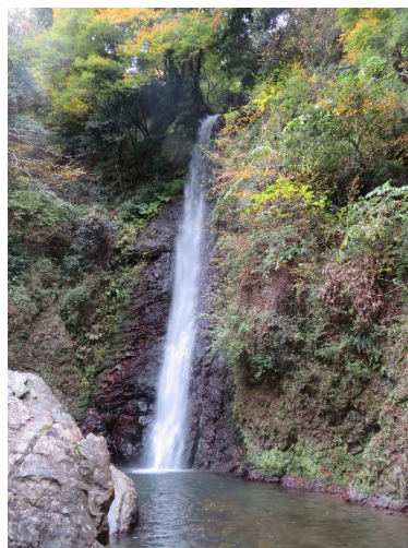
日本の滝百選・養老の滝

木々に囲まれた養老神社に参拝し、澄み切った菊水泉を覗いたのち茶店へ。どこの店でも売られている養老サイダーには菊水泉が使われていて日本最古のサイダーとも言われている。しばらく歓談し養老駅まで帰り帰路に就く。