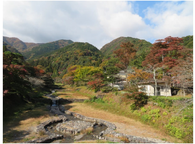
川の中もひょうたん型に整備