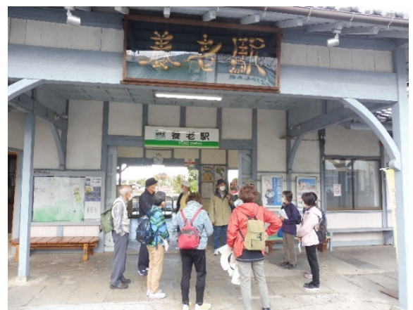
出発前の挨拶風景