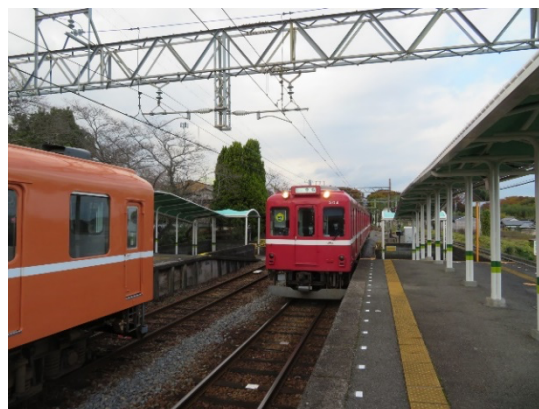
単線の為時間調整する養老線の電車