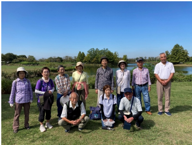
池を背景に集合写真