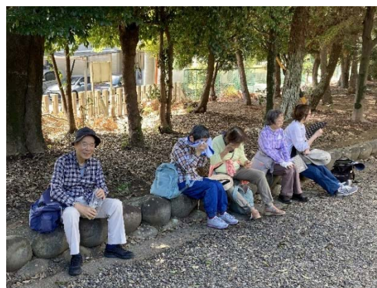
縁石に腰を下ろし汗を拭く