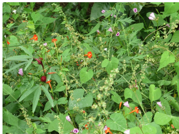
彼岸花と小さな草花(下見で撮影)