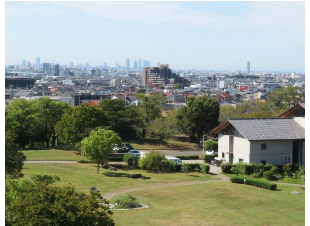
遠くに名古屋駅周辺の高層ビル