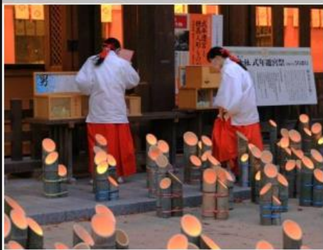
安曇野市穂高神社神竹灯(かみあかり)