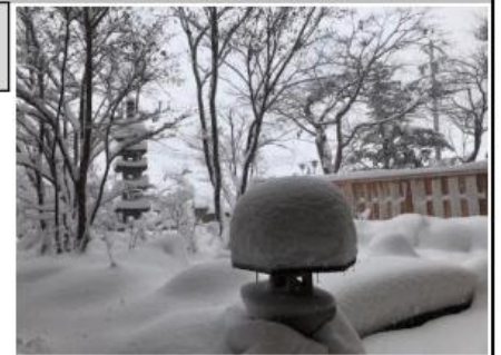
(雪が降りました 12・18)

長野県下高井郡山ノ内町渋温泉 渋ホテルのお庭です 奥信濃の素晴らしい紅葉庭園と 雪深い渋温泉の初大雪です。 同じ場所の秋と冬こんなに違い ます、スノーモンキーも温泉で 雪をかぶって年を越しました。