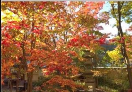
(紅葉が綺麗です 10・30)