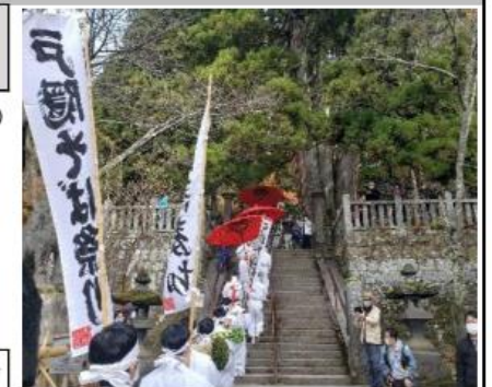
戸隠蕎麦献納祭り 11月

*****事務局は次の通り A=JTB長野支店へ検討中、②B・C=会長・事務局長宅*****