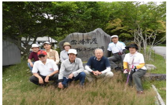
第22回 霧ヶ峰公園 7・22 参加8名