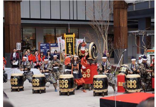
日本一の門前町大縁日(真田太鼓)