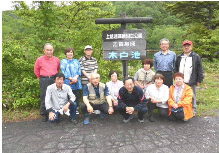
やっと晴れました、今年も楽しい親睦交流ができました