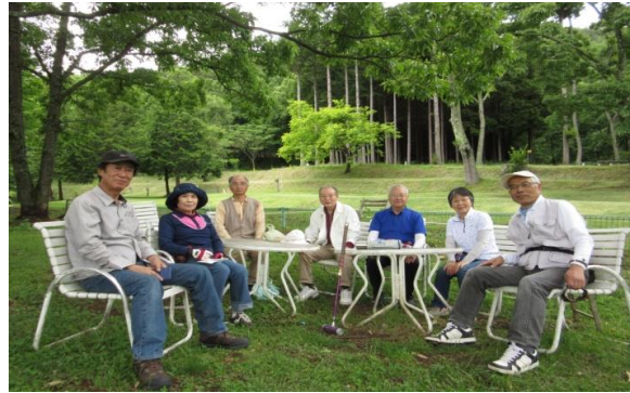
第21回 武石森林公園 6・9 参加7名