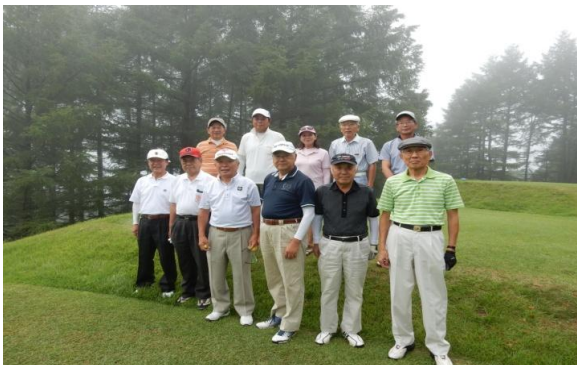
第57回 志賀高原CC 7・28 参加11名