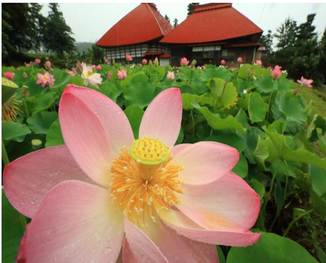
木島平村稲泉寺の蓮の花2015・7・21