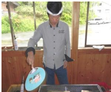
竹の子一丁上がり