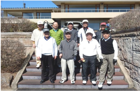
第56回 川中嶋CC 4・23 参加9名