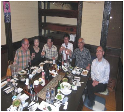
第23回 5月20日 長野駅前「笑笑」