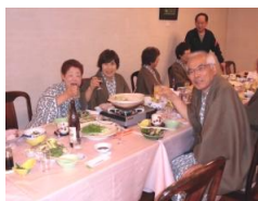
親睦はここにあり夕食会