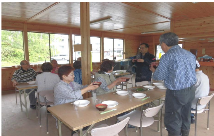
竹の子汁で乾杯・・・頂きます・・・焼き竹の子ちょうだい