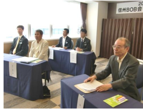
牛島会長と来賓・河合理事長野松本上田各支店長