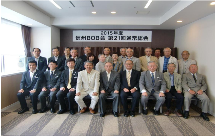
2015年 会員63名(男性45名・女性18名)