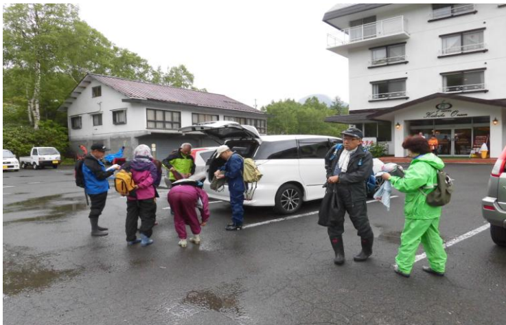
まだ雨か？ しょうがねえなあー 合羽着て出発だ