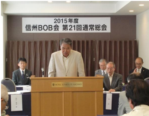
河合支部理事の挨拶と支部活動報告