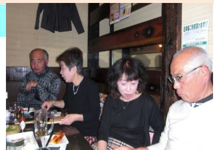
第25回松本サロン 11月25日(水)

松本は女性の参加者が多いそんな噂が広まっています、事実です、「松本サロン」はサプライズが一杯あります、支店の人も出席親睦を深める交流会です。遠方の人、たまにはご参加を!!