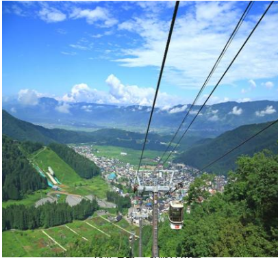
野沢温泉 森崎な田舎

今年の交流親睦会ステージは、ふるさと信州「野沢温泉」です、いつも通り静岡木犀会さんと遠方から3名が参加してくださいました。野沢温泉のキーワードは、野沢菜と温泉です。交流親睦会(懇親会28名)には、地元の方にも参加いただき、まさに大交流会の実現で大盛会でした。