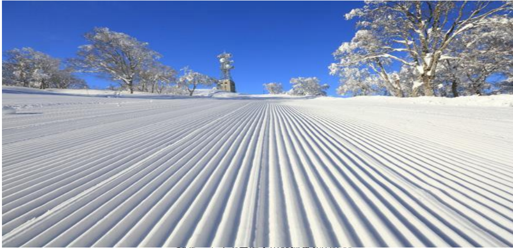
野八尾水スキー場、小幡山頂からの眺め