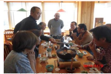
きのご鍋 珍しい種類がいっぱい

◆11月5日(木)→9:00目玉企画・野沢菜漬け体験・・・収穫・洗い・漬ける(5kg)・・・時漬けにして持ち帰り・・・この時・この日でなければ体験できない逸品、天候も最高(快晴)、記憶に残る一日になりました。