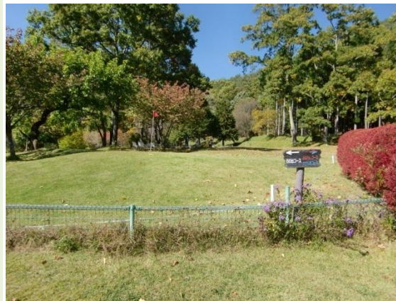
武石森林公園マレット会場

今年度の「健康マレット」は、5回の計画でしたが、2回も豪雨で中止をしました。今年も参加者は9名程度で固定しています、次年度はもっと参加し易い計画を立てますので、もっともとの参加を期待します。今年は県下全箇所から参加頂けるよう上田市丸子の「天下山」を中心に会場を設営しました、車が無いと参加が困難だったかもしれません。地域では80歳でも楽しめる健康増進スポーツとして盛んです、誰でも出来る手軽なスポーツです。知らず知らず歩行も進みます。皆さん来期は大勢参加を!!