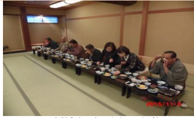
只今朝食中 ゆっくり召し上がれ