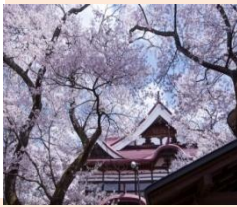
春を彩る高遠の桜