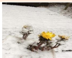
春を告げる福寿草