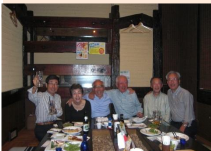
第24回松本サロン 9月16日(水)