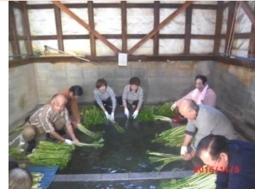
温泉の専用洗い場 腰が痛い

■お詫び・・・大懇親会の写真撮り忘れました、交流ゴルフは別ページに掲載、来年をご期待ください。