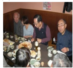
◆年6回の長野サロン、あと1回は、2月9日(火) 養老乃瀧17:00から◆