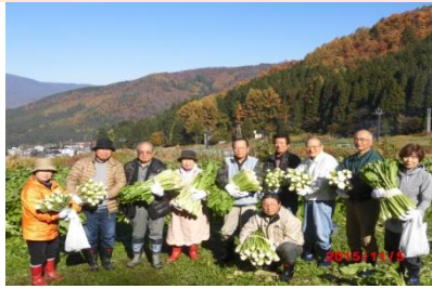
野沢菜いっぱい収穫できました