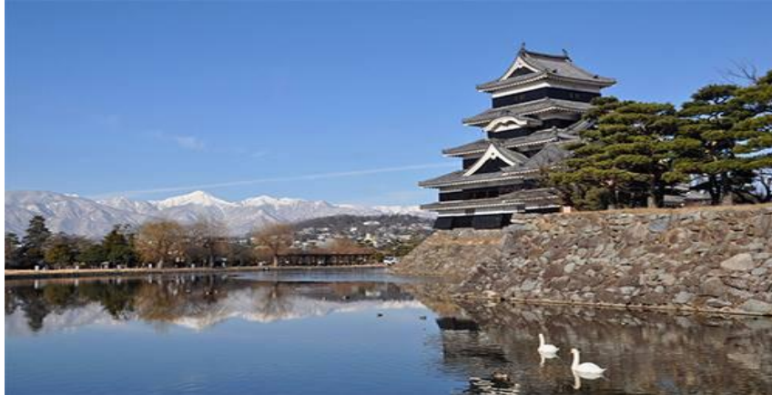
松本城と雪の北アルプス 山石徹さんの作品