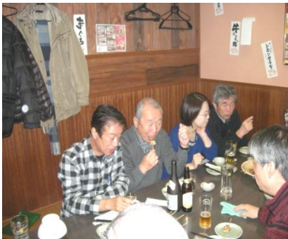
第62回長野サロン12月11日(金)