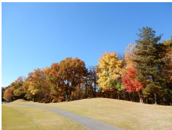
斑尾高原CC コースの紅葉

今期は天候に恵まれ一度も中止することなく和やかに開催することが出来ました。会場は各回変え、プレー代はできるだけ安価になるよう努力し協力を依頼しました。賞品も「ナイスギフト」を主にし、その他も買って無駄にならない物を用意するよう心掛けました。会員の高齢化が進み、現役も厳しい環境にあり平日に参加することが難しくなっています、3組以上の人数を確保することは大変でした。このような状況ではありますが開催を望む会員のためにも可能な限りこの事業を継続したいと思います。