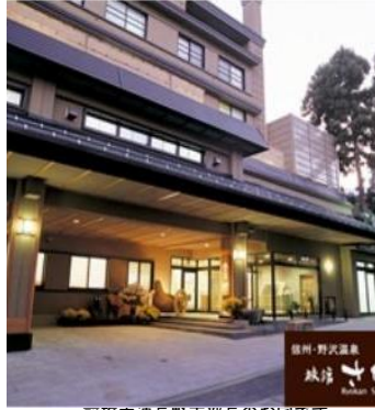
前旅ホ連長野支部長のお宅です