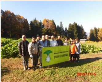
観光協会の野沢菜畑に到着

◆11月5日(木)→9:00目玉企画・野沢菜漬け体験・・・収穫・洗い・漬ける(5kg)・・・時漬けにして持ち帰り・・・この時・この日でなければ体験できない逸品、天候も最高(快晴)、記憶に残る一日になりました。