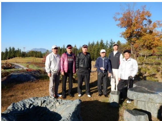
第59回 斑尾高原CC 11・05 参加6名