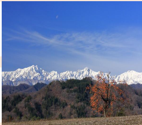
北アルプスの雄姿