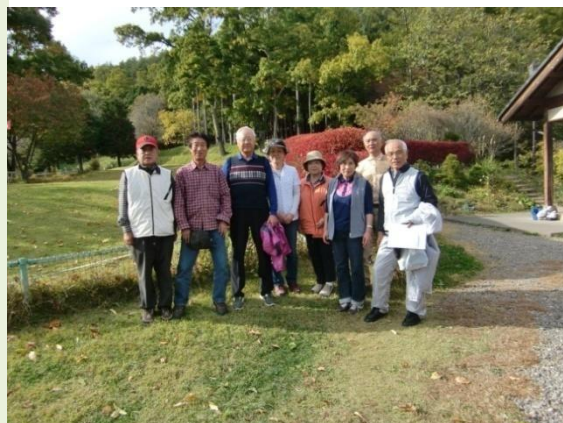
第24回 武石森林公園 10・27 参加8名