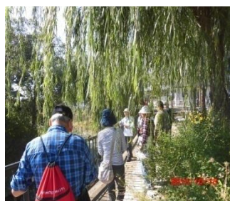
上田街 外堀から旧北國街道へ