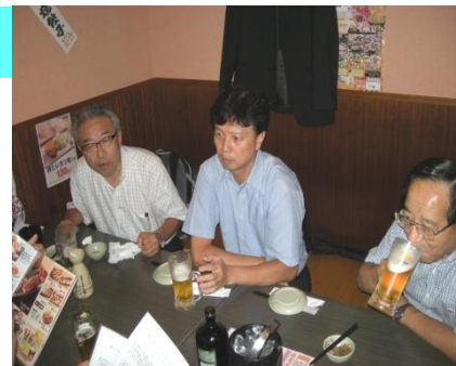
第61回長野サロン10月20日(火)

「サロン」を楽しみにしている人が増えて来ました、嬉しい事です。お酒の飲めない人も出席しています。「サロン」は談話室であり、憩いの場を目標にしています。「あの人来るかな」と想像しながら参加するのも楽しみ親睦交流劇場です。