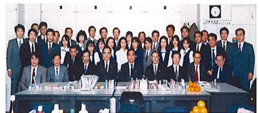
平成元年型 JTB教育旅行札幌支店 納会 平成元年12月26日

当時小職は入社9年目(31歳)で、団体旅行札幌支店の教育旅行担当として長く続いた教育旅行営業から早く抜け出たく画策しましたが、なんと教育旅行札幌支店の配属になってしまいました。兎に角、個性の強い先輩ばかりで業務以外のコミュニケーションは長きにわたり毎日大変だったと記憶しています。その10年後に想定もしていなかった教育旅行札幌支店を背負っていく立場になり、現在はシニア社員を経てマスタースタッフとして教育旅行の手配をしています。これも運命ですね。イヤ、もしかしたらJTBグループに40年以上お世話になり幸せな業務人生だったかもしれません。