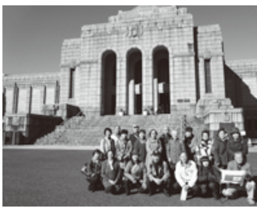
聖徳記念絵画館を背に

第2回目となる今回は、「京葉倶楽部25周年記念」の特別企画として4月開催と同内容で実施しました。