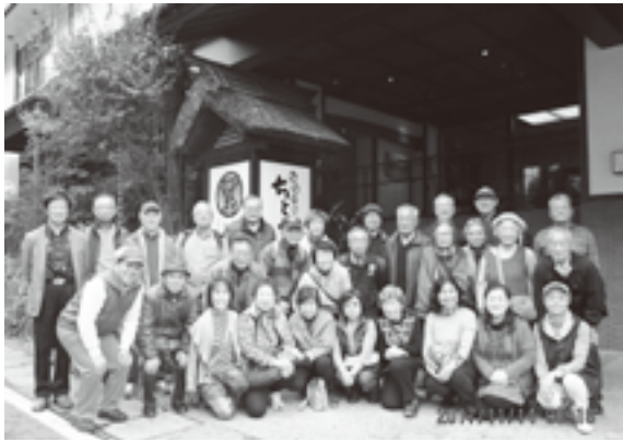
「ひなの宿ちとせ」にて

宿は、日本三大薬湯の一つ、松之山温泉「ひなの宿ちとせ」。お湯は、美肌や冷え症に効果的とのこと。ゆつくりと浸かりました。夕食は地産の物が中心。新米のこしひかりを美味しくいただきました。2日目は、松之山温泉の新名物、郷土料理をアレンジした「朝まんま」を食べて出発。温泉近くにあ