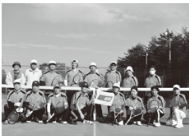
ンゴ狩りで秋を楽しみました。成績は次のとおり。

いつもどおり好プレー・珍プレーの連続で大変盛り上がりしました。試合後は、コテージでカラオケやゲームで懇親を深め、帰路はリ