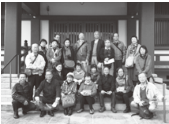
神楽坂 光照寺にて

午後は、東京理科大学近代科学資料館・数学体験館を見学。熱心な大学生の説明に、久しぶりに数学の楽しさを味わいました。今回はバラエティにとんだ楽しい散策でした。(長戸 記)