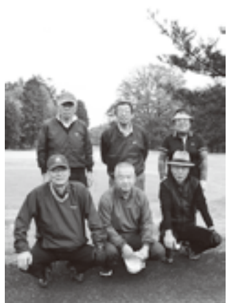
◎カレンダー巻きボランティア(報告)

会員の密やかな楽しみの一つ、「JTB支援ボランティア・カレンダー巻き」を、11月24日と28日、法人小山支店と法人宇都宮支店で今年も行いました。