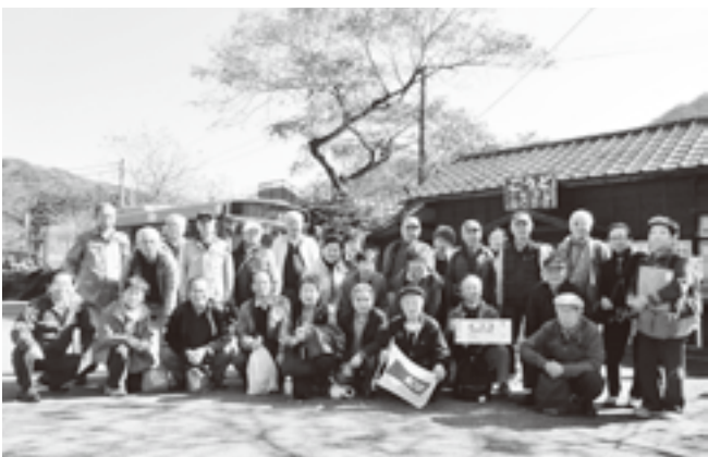
わたらせ渓谷鐵道 神戸駅にて

憧れのトロッコ列車に乗り、名物の「トロッコ弁当」に舌鼓。窓越しに爽やかな秋風を感じながら、溪谷美に思わず感激! あつという間に神戸駅に到着。バスにて富弘