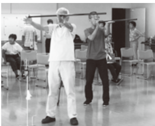
合宿時の吹き矢風景(7月)

現在、会員29名中19名が有段者となりました。次回は3月7日(木)に実施しますが、未経験の方も大歓迎です。ぜひご参加ください。(清水 記)