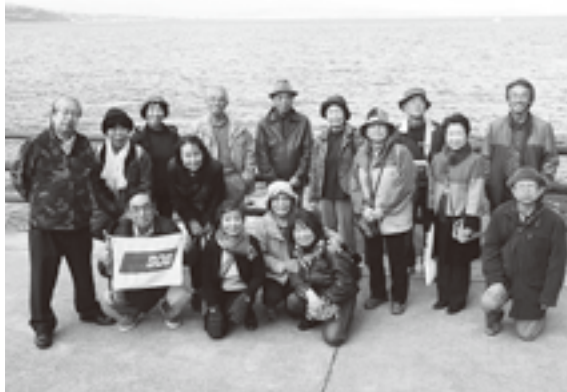
昼食場所「うに清」前にて

11月20日、前夜の雨とは打って変わった秋晴れの下、真鶴駅に17名が元気に集合、路線バスにて真鶴岬に向かいました。