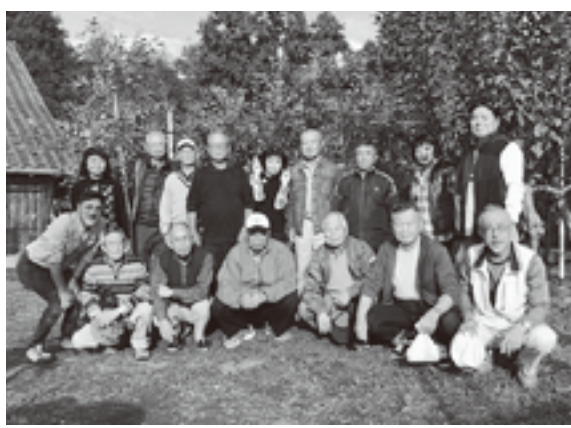
直営農家でりんご狩り

そば打ち体験とリンゴ狩り(報告) 11月12日、秋晴れの中、常陸秋そばの産地、常陸太田で開催しました。参加者は17名。初めての人、