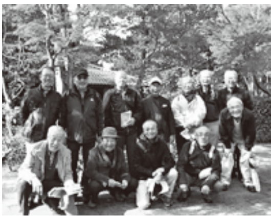
昭和記念公園内の日本庭園にて

春の桜も見事ですが、人間四季が入るとなぜか秋の紅葉に魅せられるようです。ましてや晴天に恵まれ、かつての同志と談笑しながら色とりどりの樹々の下を歩けば、たまさか出くわしたマラソンの若人の元気には敵わぬものの、身も心も軽やかにになります。