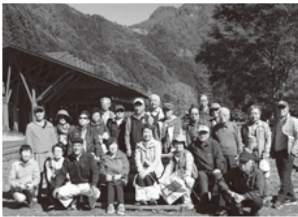
◎JTB支店支援ボランティアで

りの森」で秩父錦などの地酒の試飲で喉を潤し、秩父ミュージズパークで色づいた銀杏通りを散策しました。とても見事な並木でした。道路は渋滞もなく、行きは道の駅「あしがくぼ」、帰りは「フォレスト花園」に立ち寄り、買い物を楽しみながら予定どおり帰路につきました。(酒井 記)