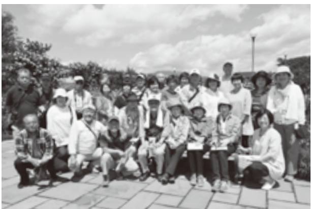
一本木公園のバラ園にて

5月29日、他倶楽部の参加者も 含め、総勢26名を乗せたバスが高 崎を出発しました。