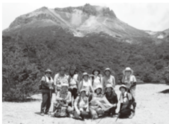
茶臼岳をバックに

帰路は板室温泉で湯を楽しみ、千本松牧場で小休憩をとって宇都宮へ。グッタリ疲れ、体中筋肉痛となりましたが、お天気に恵まれ、楽しく有意義な一日でした。 なお、この日の様子や美しい景色は支部HPで! (船山 記)