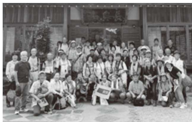
紹太寺(扁額は山岡鉄舟の書)にて

戊辰戦争の山崎古戦場碑など、スキの揺れる道をたどり、3時過ぎに箱根湯本駅に到着しました。日本橋から90km、次回はいいよ。天下の険、箱根山です。