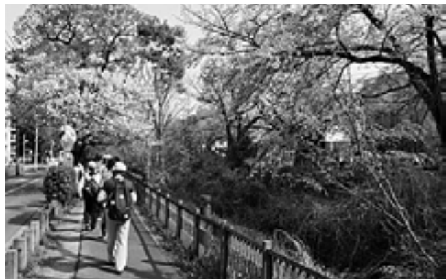
小桜橋近辺を歩く

その後、遊歩道に舞い落ちた桜の花びらを愛でつつ歩を進め、途中希望者は『平櫛田中彫刻美術館』に立ち寄りしました。国立劇場に展示されている『鏡獅子』の作者で、数々の作品の他、田中が100歳の時に購入した彫刻用のクスノキが庭に展示されており、その分量が20年分と知って驚きました。年齢