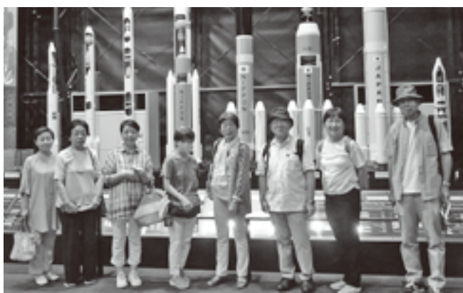
JAXA筑波宇宙センターにて

の移動で皆心地良く夢の中、火星に行けたのかどうか。1985年開催のつくば科学博の展示物もあり、当時を思い出懐かしく見学。今回の2施設の見学で、少しは宇宙の謎、科学の不思議に触れた気がしました。(多々良 記)