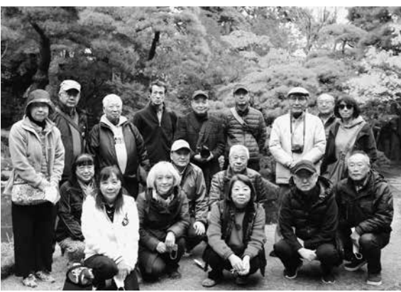
旧齋藤家別邸の庭園にて

今回は「紅葉の旧齋藤家別邸と新蕎麦を楽しむ」というタイトルの下、新潟市の中心街で、目と舌でゆっくり秋を味わう企画です。11月18日、17名の参加で開催しました。新潟市のシンボルタワーNEXT21に集合し、中心街の名所であるどつぺり坂や新潟大神宮、旧日銀支店長役宅に立ち寄り、今回の目的の地、旧齋藤家別邸に到着。国指定の名勝で新潟三大財閥の一つ齋藤家が正時代に迎賓を目的に建設しました。広間から見える庭園の紅葉が見頃で、抹茶と和菓子をいただきながら深まりゆく秋