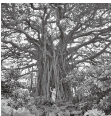
喜界島の大木カジマロ(筆者は木の根本)

喜界島では、超太木のカジマロに感動、そしてサトウキビ畑の丘を突っ切り、遠くの空まで延びる直線道路に感動。これまた機会を設け、お出かけください！