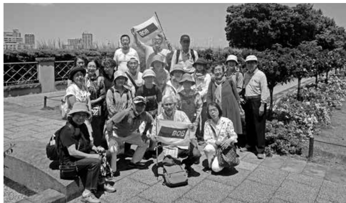
外交官の家のバラ園にて

山手111番館、横浜市イギリス館を皮切りに、異国人の集合住宅山手234番館、生糸商のエリスマン邸、エリア最大規模のベ-