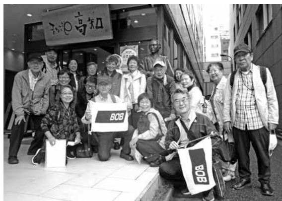
高知ショップにて (竜馬がいます)

山形で有名な『アルケッチャーノ』のシェフがプロデュースしたお店です。パスタランチは、まず彩りも種類も豊富な野菜、そして舌触りが優しいスープ。メインのパスタは3種類から選べ、デザートの塩ジェラートがこれまた美味！みんな笑顔になりました。スタッフの皆さんのテキパキとした姿、スムーズな対応に気分よく解散となりました。(橋本 記)