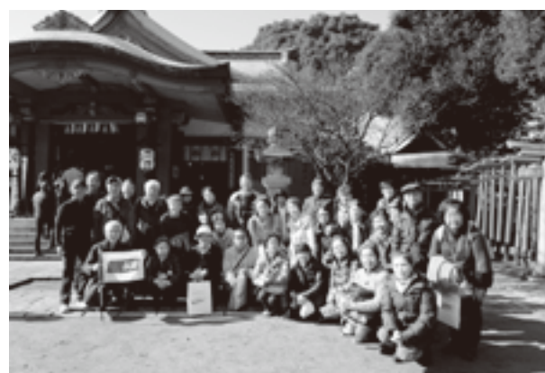
品川神社(大黒天)にて

しみランチは、マリオットホテル のダイニング。ワインで乾杯の後、 豪華な3種のミートプレート料理 を堪能。大満足のうちに散会しま した。(杉田 記)