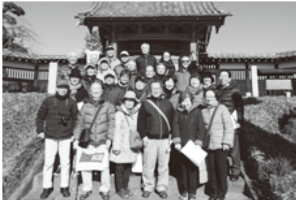
正定寺（弁財天）にて

◎古河七福神巡り（報告） 快晴に恵まれた1月11日、古河駅に26名が集まり、地元ボランティアガイドと共に出発。まずは駅前の万葉歌碑で、古河が昔から水運の要地だったことを確認。