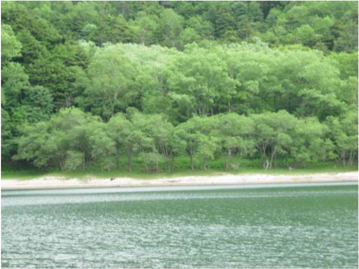
8 刈込湖 (1)