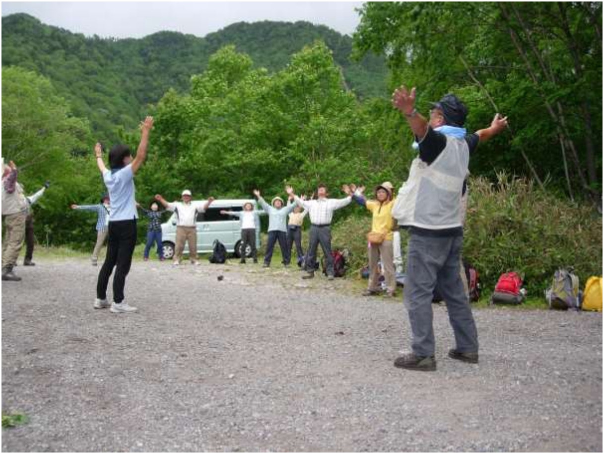
2 出発前 (2)