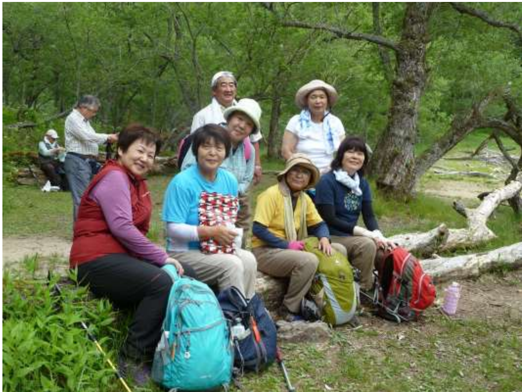
5 昼食のひと時 (2)