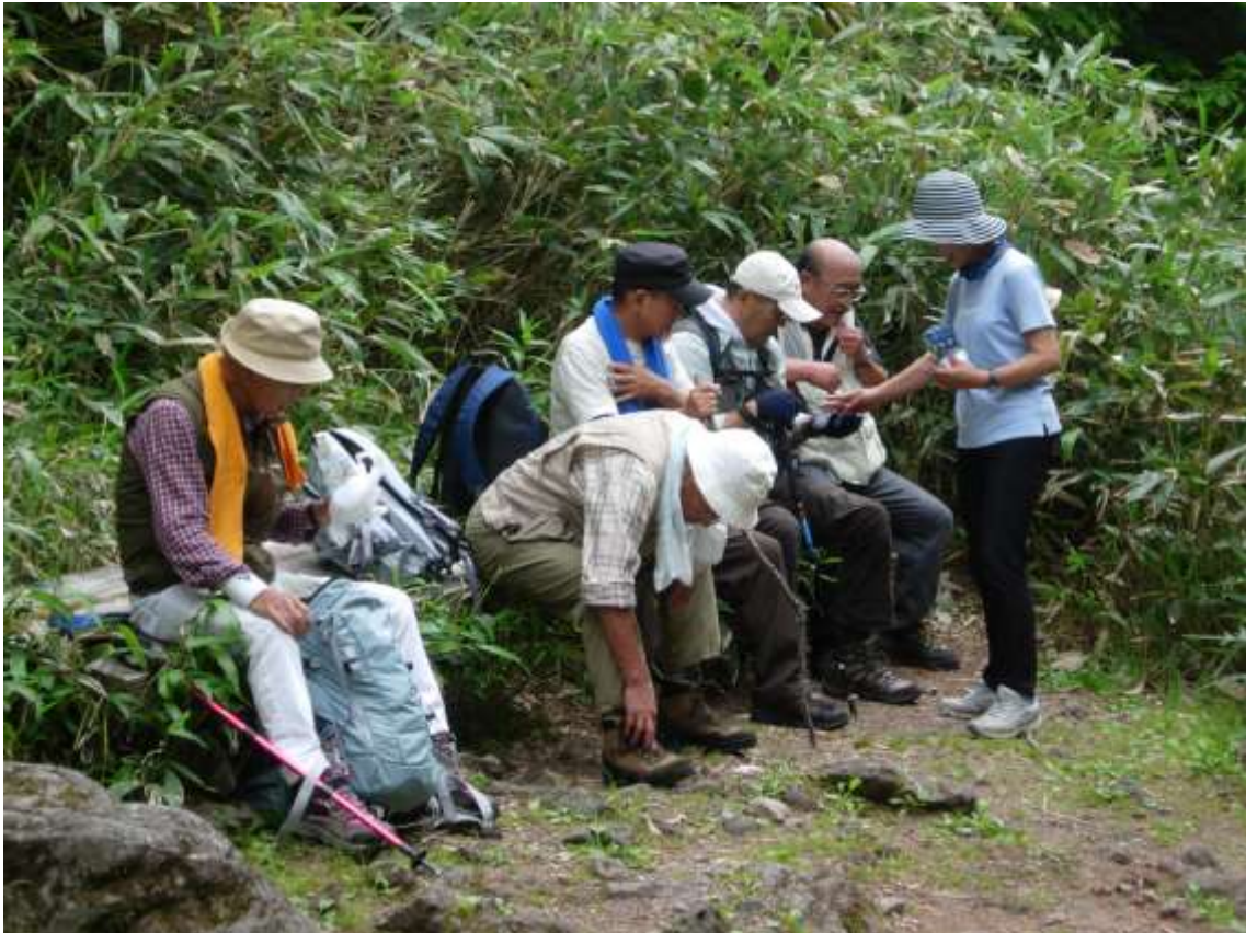
4 昼食のひと時 (1)