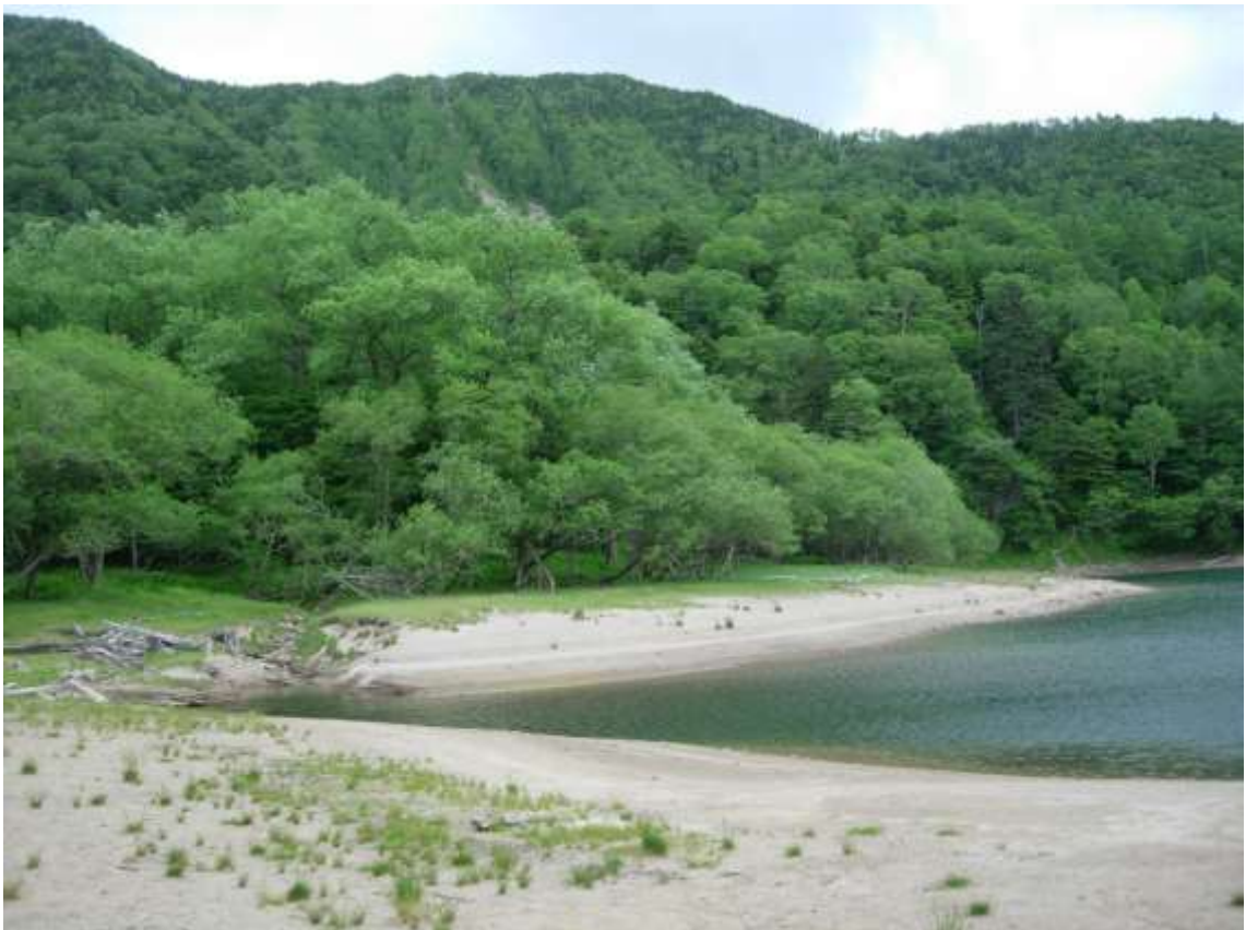
9 刈込湖 (2)